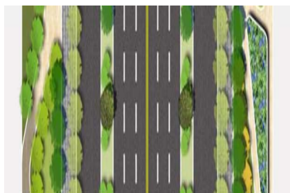
工业段道路景观平面图

工业区域的道路景观植物色彩可选择大面积种植绿色系、抗灰尘、可净化空气的植物,营造生态感道路景观。