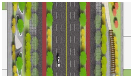
居住段道路景观平面图

城市当中生活气息浓郁的街道中,可种植芳香植物、观赏性植物等,植物色彩可适当丰富一些,同时可搭配景观小品或休憩座椅等,营造舒适而又温馨的景观氛围。