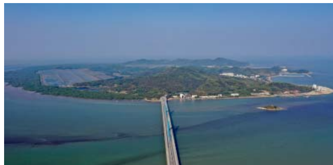
图1 淇澳岛全貌

的是,在淇澳岛上的后沙湾、东澳湾古遗址,考古研究人员曾发掘了大量距今约4500至5000年的彩陶和白陶,它们是珠海迄今最早人类活动的证据,而淇澳后沙湾遗址是目前我国珠江三角洲较完整的新石器时代末期渔猎文化遗址,具有深刻的考古学和人类学研究意义。另外在非物质文化遗产方面有端午祈福巡游、银虾酱制作工艺等。