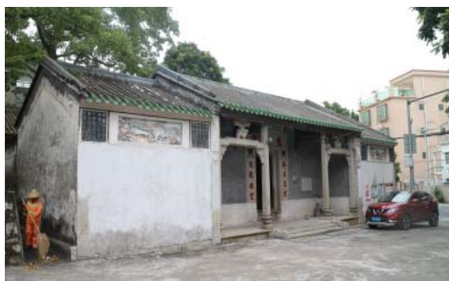
图2 淇澳岛文昌宫外观

总体来看,村庙建筑在传统社会始建时,居民住宅远离庙宇、祠堂,因为这些地方“阴气”较重,不利于人间生活。但是随着城市的发展,人口的增加,村落内可使用宅基地面积的有限,目前在沿海地区的村庙建筑已被周围的民宅所包围。它们具有五个重要的特点: