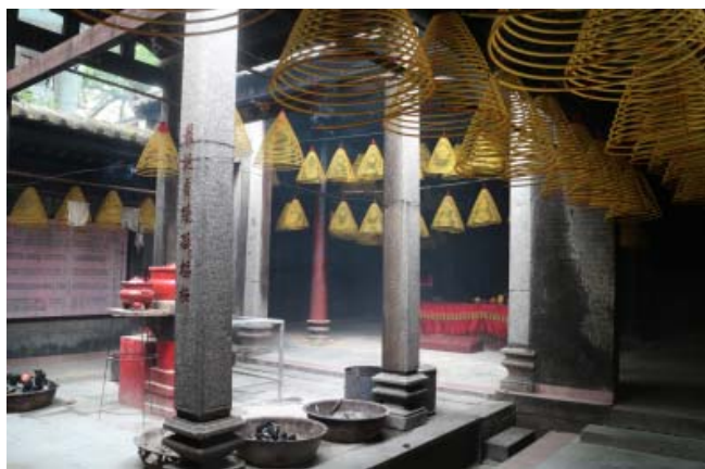
图5 淇澳岛文昌宫香亭

第二进大殿进深13檩, 屋顶形式与头门相同。正中四根圆木金柱, 前檐柱为方形讹角石柱, 方形花瓶式石柱础。柱础后檐柱采用圆木柱, 圆形覆盆式石柱础。金柱柱础做法与头门后檐柱柱础相同。前后金柱之间有九架梁, 梁上设沉式瓜柱承托上一层梁和檩条。前檐后檐进深3檩, 插梁式做法。室内墙面和地面均为现代重修。