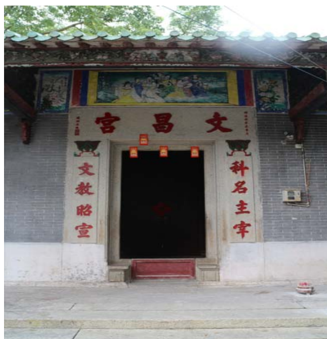
图4 淇澳岛文昌宫头门